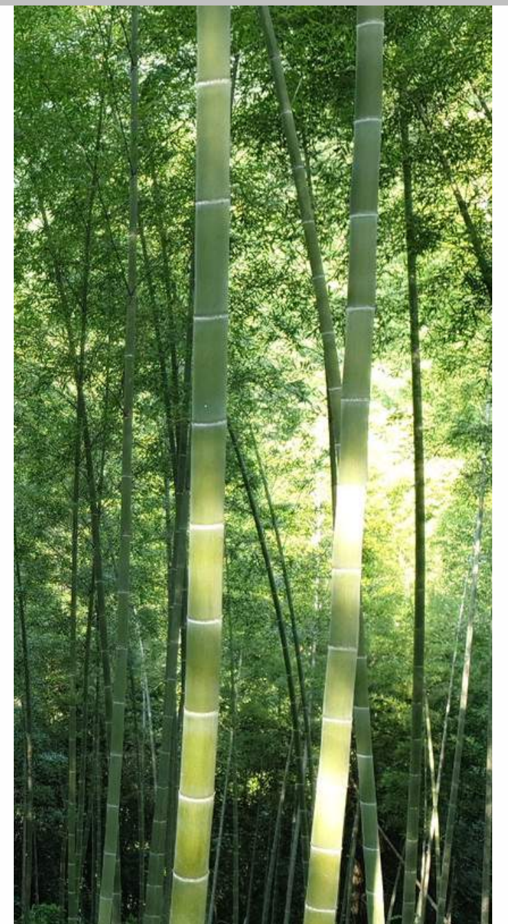
Bambuswald unseres Lieferanten in Youxi, China